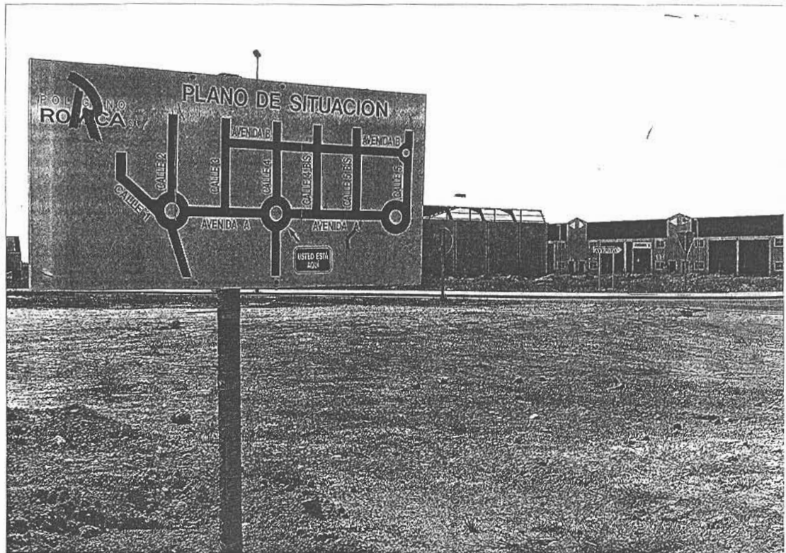
El Polígono Industrial de ROMICA está en fase de crecimiento gracias al apoyo de las instituciones y CCM Desarrollo Industrial.

La oferta de suelo del Polígono Industrial de ROMICA en Albacete viene a demostrar el gran momento económico y comercial de muchas empresas de Albacete; un flujo de trabajo, negocio y empleo que necesita espacios en condiciones óptimas de urbanización, como es el caso de la tercera fase del Polígono. El desdoblamiento de la carretera N-322 va a dejar paso a un prometedor futuro para las empresas instaladas en los 2,7 millones de metros cuadrados con los que cuenta ROMICA.