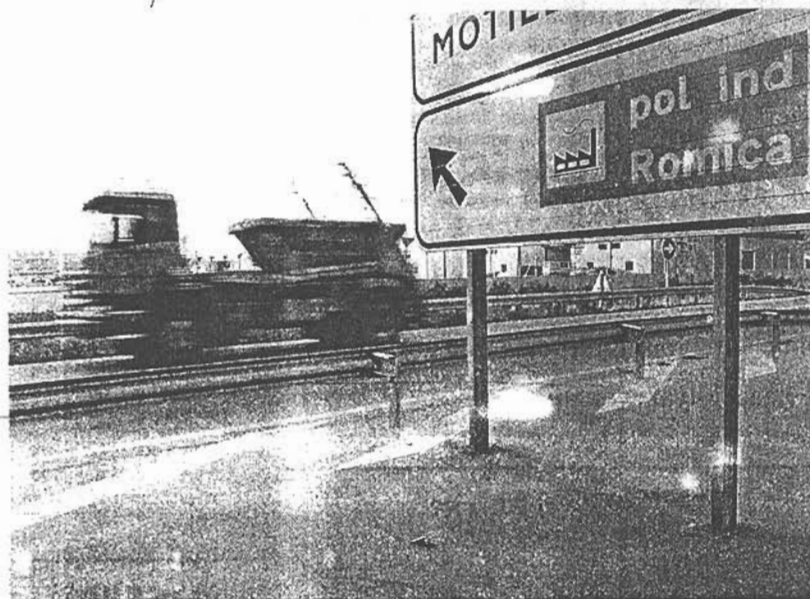
UNA CARRETERA DESCUIDADA. Accesos a Romica desde la carretera de Motilleja.